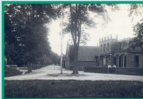
Hoek Middenweg/van Veenweg ca.1915