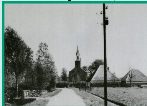
De kerk van Veenhuizen, ca 1950