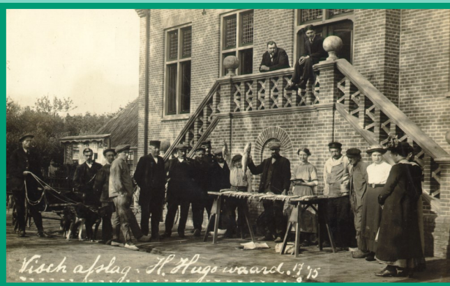
Oude gemeentehuis op de Middenweg, 1915