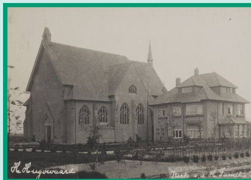
De kerk van Heerhugowaard Kruis, ca. 1920