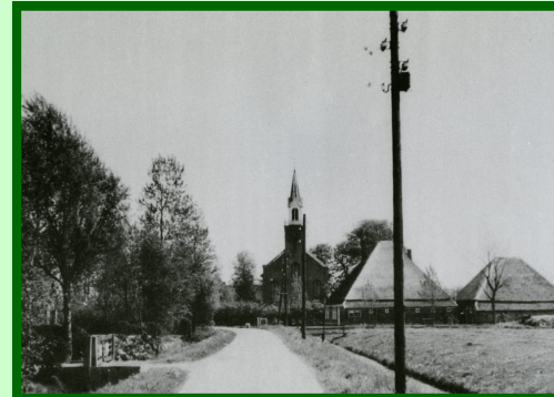
De kerk van Veenhuizen, ca 1950