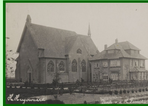
De kerk van Heerhugowaard Kruis, ca. 1920