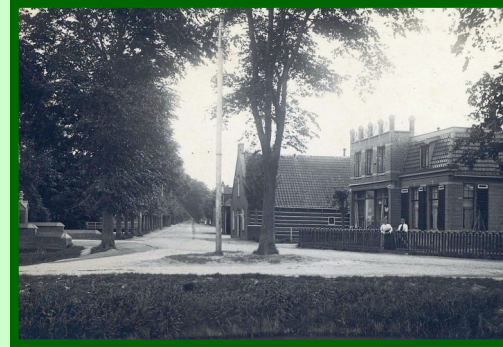
Hoek Middenweg/van Veenweg ca.1915